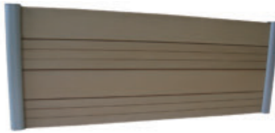
Variation gerillte und glatte Oberfläche